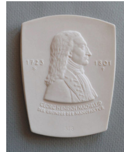
Plakette zum 200. Gründungsjubiläum der Ältesten Porzellanmanufaktur Volkstedt im Jahre 1962, Porträt von Georg Heinrich Macheleid, dem Gründer der Manufaktur

Bereits zu Lebzeiten erfuhr der Erfinder des Thüringer Porzellans eine verdiente Ehrung: Besonderer Beweis fürstlicher Huldigung war, dass Durchlauchigster Landesherr ihn in Lebensgröße malen ließ, um diesen für sein engeres Vaterland verdient gewordenen Erfinder auch noch der Nachwelt vor Augen führen zu können . Wie Hugo Macheleidt dazu 1902 weiter schrieb, befindet sich dieses Bild noch im Besitz Seiner Durchlaucht des Fürsten von Schwarzburg-Rudolstadt und hängt im Entree des Jagdschlusses „Fasanerie“ bei Schwarzburg [Rudolstädter Zeitung 32 (1902) Nr. 56 vom 7. März]. Heute gehört es zum Inventar des Thüringer Landesmuseums Heidecksburg in Rudolstadt (erste Abbildung des Beitrags).