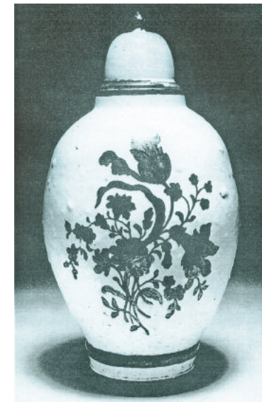
Deckelvase mit Blumenmalerei in Gold und Braun, Porzellan; Volkstedt 1762 bis 1765, Angermuseum Erfurt

Fortan nahm Fürst Johann Friedrich von Schwarzburg-Rudolstadt unmittelbar Einfluss auf die Entwicklung des Unternehmens. Er verglich Macheleids Produkte mit denen aus Meißen und Fürstenberg. Allerdings fand er, dass die Glasur immer noch etwas blättrich aufwies und zu rau ausfiel. Auch sagten ihm die Formen und Größenverhältnisse des Geschirrs anfangs nicht zu. Doch schon im August 1762 fand er die vorgelegten Stückgen recht fein in der Glasur, ich wünsche, daß alles so ausfallen möge, so wird unserem ehrlichen Macheleid Volkstedt bald lieb und schätzbar werden.