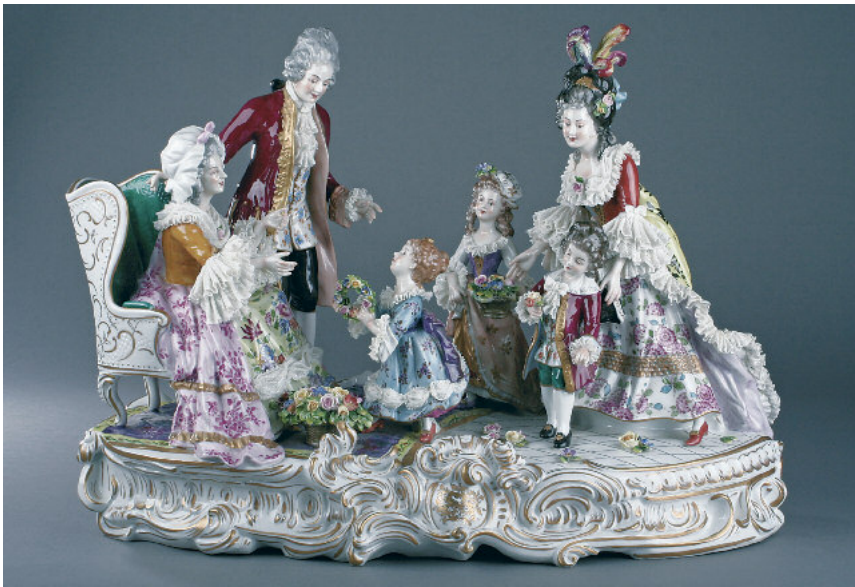
Großmutter's Geburtstag, Carl Fuchs, Ausformung nach 1954, Volkstedt