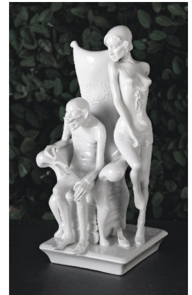
Liebespaar. Porzellanmanufaktur Kati Zorn aus Anlass „250 Jahre Thüringer Porzellan“, Volkstedt 2010

Insgesamt wiesen Thüringer Kaoline um 6 bis 10% niedrigere Tonerde-Gehalte auf, verglichen mit den Rohstoffen des Meißener Porzellans von Aue und Seilitz, so dass die Thüringer Produkte reicher an Quarz und ärmer an Al 2 O 3 sind.