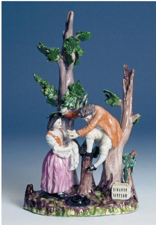
Die Vogelsteller, Allegorie der Luft; Volkstedt um 1775 Thüringer Landesmuseum Heidecksburg, Rudolstadt

Die Volkstedter Manufaktur hatte um 1775 in Königsee und gegen 1781 auch im benachbarten Schaala Hilfsbetriebe für die Masse- und Glasuraufbereitung eingerichtet. Mit der daraus resultierenden Stilllegung des Sitzendorfer Präparationswerkes siedelte Macheleid nach Schwarzburg über.