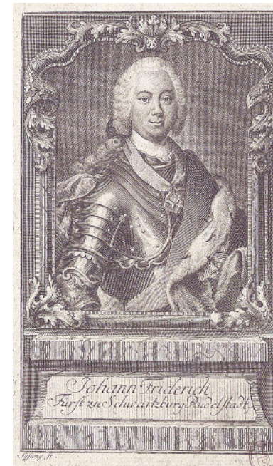
Johann Frdrich Fürst zu Schwarzburg-Rudolstadt, Kupferstich von Johann Christoph Sysang nach einem Gemälde von Johann Christoph Morgenstern